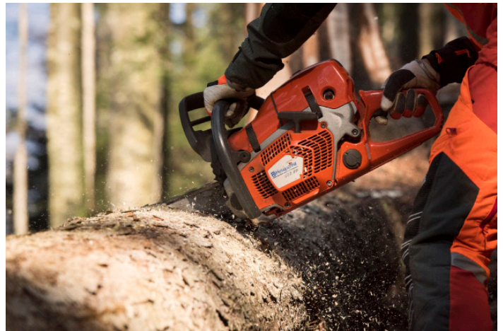
572XP® har et forbedret vekt/effektforhold sammenlignet med andre motorsager i samme segment.

Soft cut out-systemet beskytter motoren fra for høye turtall, og systemet justerer automatisk tenningen ved maks turtall. Dette betyr 30 % reduksjon av trykket i motoren, sammenlignet med Husqvarnas motorsager som ikke har denne funksjonen. Det gir jevnere drift, lavere arbeidstemperatur og maksimal brukstid.