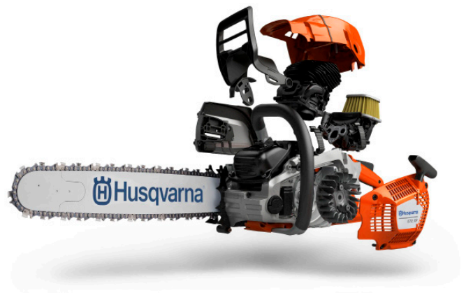
AutoTune™ har blitt oppdatert og den automatiske justeringen er nå opp til ti ganger raskere enn tidligere versjoner.