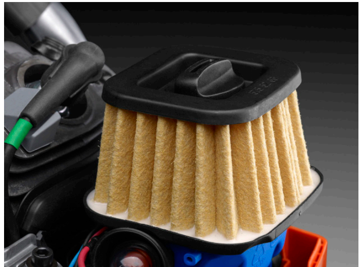
Det nye luftfilteret er ekstra effektivt takket være den store filterflaten, som gir lengre brukstid og bedre filtrering.