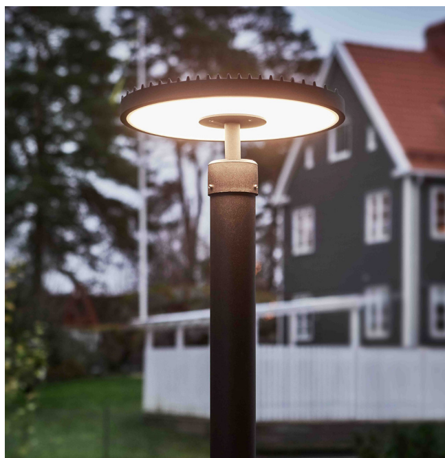
Nyheden Plate har 120 graders spredningsvinkel på lyset.

Væghængte Pelham, Dandy, der er inspireret af en engelsk gadelampe og den klassiske model Sphere er nyheder fra Markslöjd.