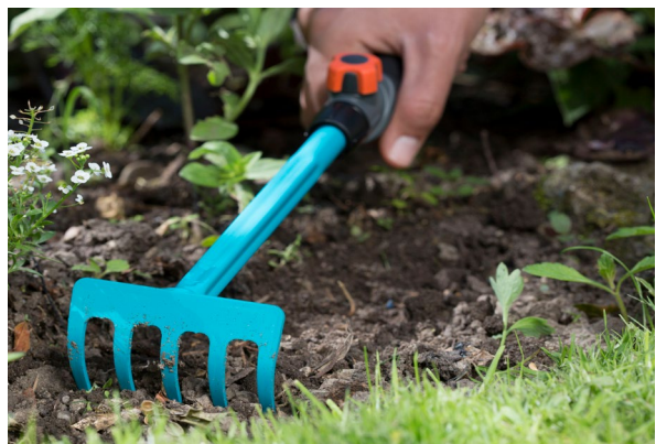
GARDENAs blomkratta är perfekt för att luckra upp jordytan innan du vattnar, då har jorden lättare att suga upp vattnet.

GARDENAs blomkratta är ett praktiskt litet verktyg att använda när man vill luckra upp jord i rabatter. Krattan är tillverkad av rostskyddat stål och har ett ergonomiskt handtag. Krattan ingår i GARDENAs combisystem där alla handtag kan kombineras med alla redskap. Rekommenderat cirkapris, 130 kr.