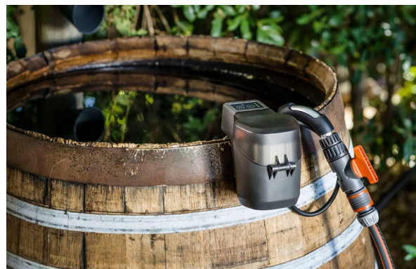
Årets smarta bevattningsnyhet! Med GARDENAs batteridrivna vattenpump kan du enkelt vattna med regnvatten.