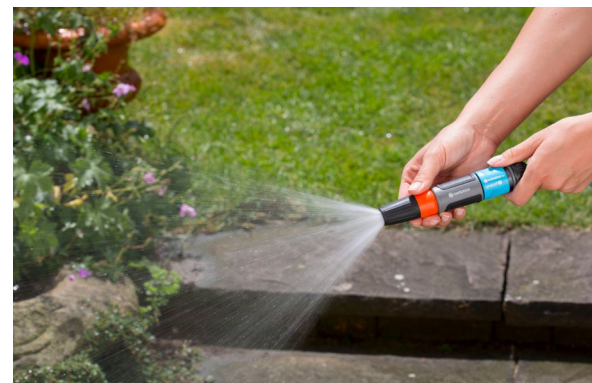
GARDENAs nya startset med munstycke och anslutningskopplingar gör det lätt att välja rätt stråle och därmed spara på vatten.