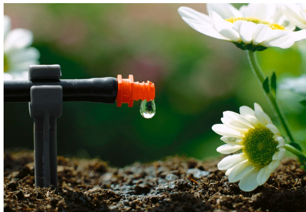
Spara upp till 70 % vatten med en vattensnål och reglerbar droppbevattning som Micro-Drip-System från GARDENA.

Med en vattensnål och reglerbar droppbevattning som Micro-Drip-System kan man spara upp till 70 % vatten. Dessutom slipper du gå runt och vattna och kan resa bort utan att be om hjälp med vattningen. Perfekt för balkonger, altaner, växthus och trädgårdsland. I kombination med GARDENA smart system kan bevattningen också styras via en app i mobilen. Rekommenderat cirkapris startset, från 350 kr.