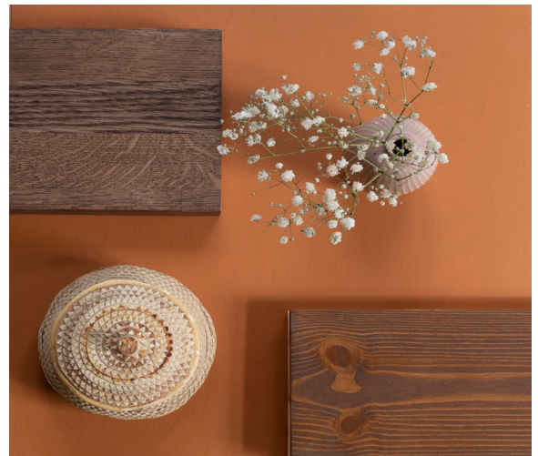
Osmo Color Öljypetsillä voi korostaa puupintaa kauniisti sitä peittämättä.