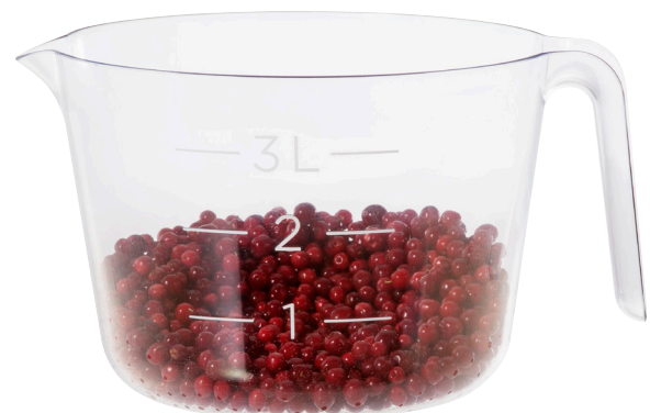
GastroMax-leivontasarja täydentyy tyylikkäällä, keskenään pinoutuvilla leivontakulhoilla.