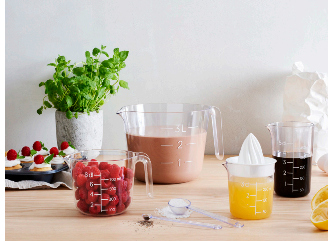
GastroMax-sarjan tyylipuhtaissa leivontakulhoissa ja mitta-astioissa on selkeät mitta-asteikot. Ne pinoutuvat keskenään, säästäen keittiön kaapitilaa.

Painokelpoiset kuvat ovat ladattavissa perpr.fi