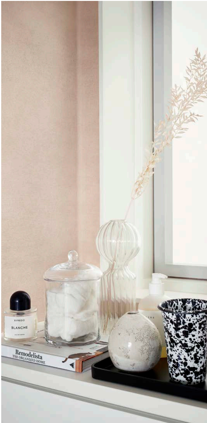
Aquarelle Rustic Velvet -seinäpäällystettä saa kolmessa pehmeässä sävyssä: Blush, Dusty Green ja Linen.

iQ Surface -mallisto on tunnettu kestävyydestään ja se sopii erinomaisesti esimerkiksi kodinhoituhuoneeseen joko lattian tai seinän päällysteeksi. iQ Surface -vinyyleissä on modernit mutta leikkisät kuosit. Voimakkaamman kuvion kanssa sopii yhteen Aquarelle Rustic Velvet Blush -seinäpäällyste, joka muistuttaa ulkonäöltään kalkittua pintaa.