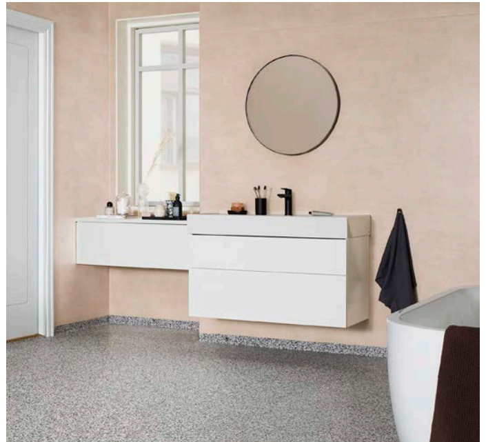
Aquarelle Rustic Velvet muistuttaa kalkittua seinäpintaa. iQ Surface -vinyyli antaa kokonaisuuteen kaunista kontrastia.