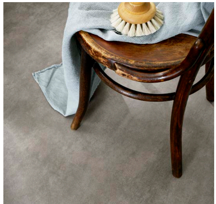
Aquarelle Raw Concrete Dark Grey -vinyylissä on betonikuviainen kuosi.