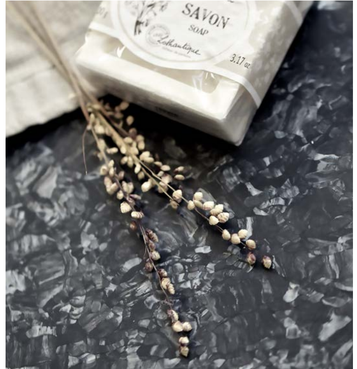
iQ Megalitin kuviossa näkyy isoja metallisia hiutaleita. Inspiraationa ovat toimineet luonnon mineraalit.