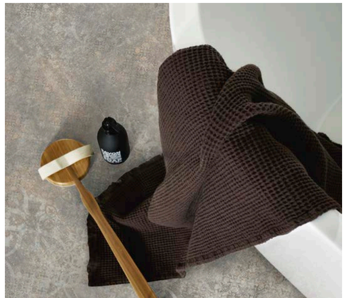
Marrakech-tyylinen Aquarelle Carcassonne Concrete Blue. Lattiaa saa 3 tai 4 metrin levyisenä.