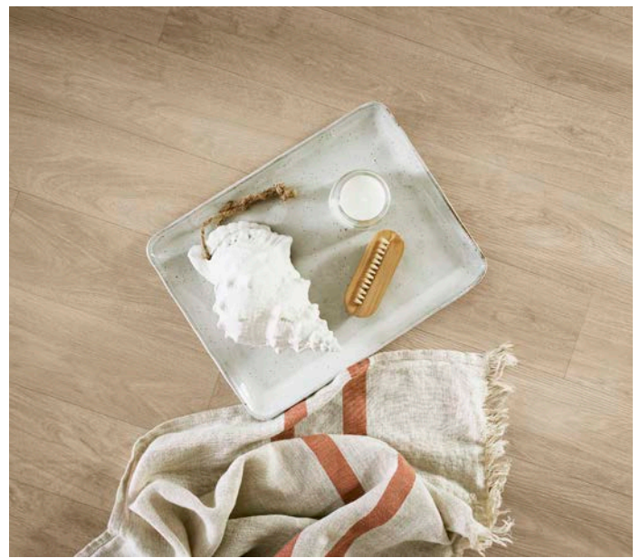
Puukuvioinen kuosi luo rauhallisen ja luonnollisen ilmeen kodinhoitotilaan tai kylpyhuoneeseen. Kuvan lattia on nimeltään Aquarelle Oak Beige.