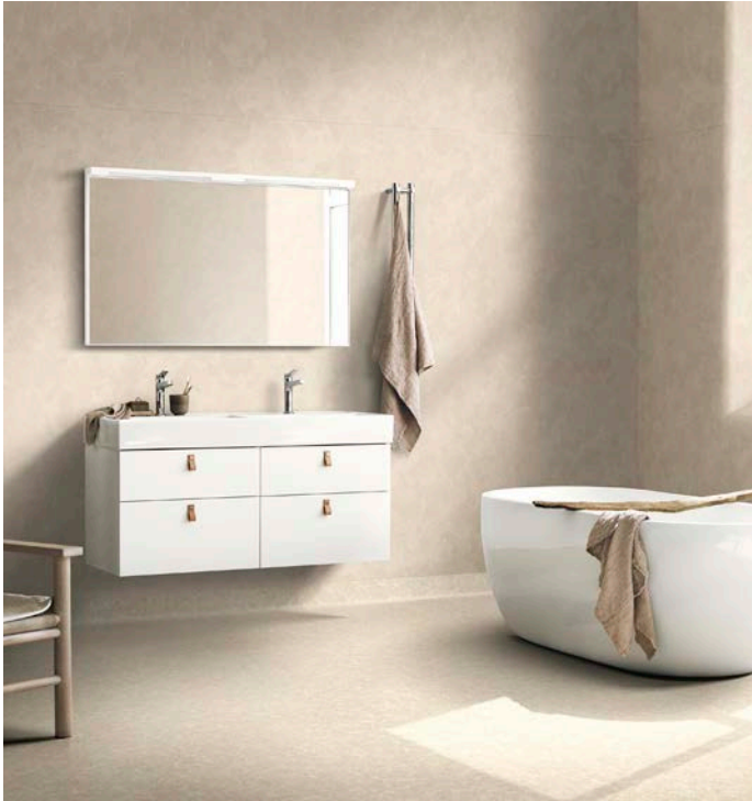
Marmori on aina muodissa! Marmorikuosisia seinän- ja lattianpäällysteitä löytyy eri väreissä: mustana, valkoisena, beigenä ja vihreänä. Kuvassa Royal Marble Light Beige -seinänpäällyste ja Aquastone Grege -lattia.

Tarkettin märkätilamallistossa on monta erilaista kivi- ja betonijäljitelmää, jotka sopivat rouheamman tyylin ystäville. Kovaa teollista ilmettä voi pehmentää puisilla yksityiskohdilla ja pehmeillä väreillä. Monissa kuoseissa on kohokuviointi, joka luo aidontuntuisen pinnan.