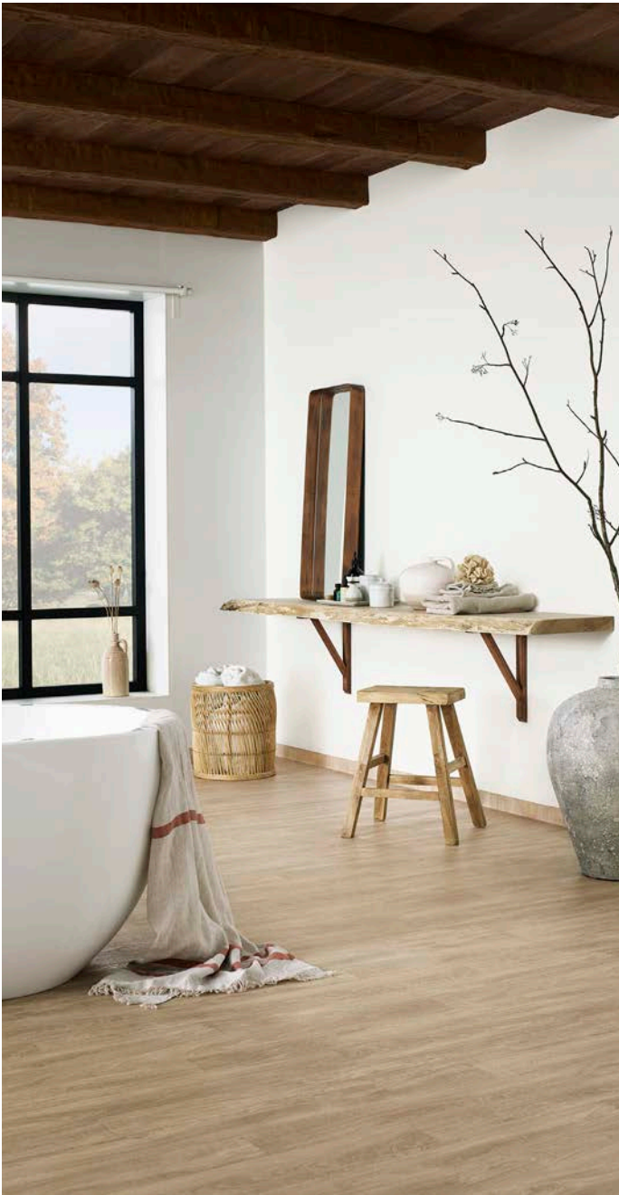
Aquarelle Oak Beige -vinyyli sopii erinomaisesti yhteen lämminsävyisen Aquarelle Soft Super White -seinäpäällysteen kanssa.

Aidon puulattian luonnollista lämpöä kylpyhuoneeseen saa puukuviolisella Aquarelle Oak Beige -vinyylillä, joka on sekä kestävä että vesitiivis. Tyyliin sopii erinomaisesti lämminsävyinen vaalea seinäpäällyste Aquarelle Soft Super White. Lämpöä huokuva sisustus viimeistellään luonnonmateriaalista valmistetuilla esineillä ja huonekaluilla.