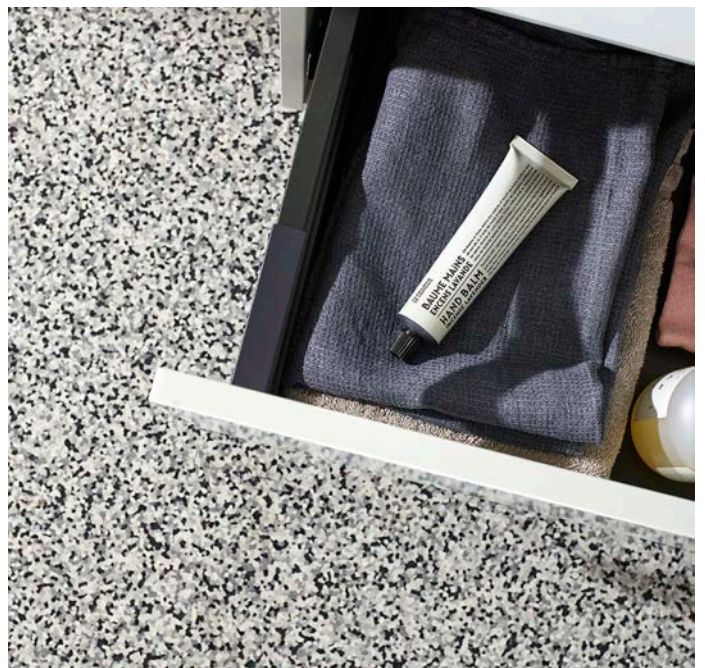
iQ Surfacen kuvioitu pinta muistuttaa ylellistä Terrazoa.