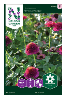
Isotsinnia 'Cresto! Violet'