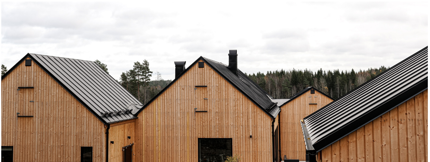
Plannja Bandtäckning i kulören PL 01 Svart med matt beläggning.

Ett grönt alternativ. En stor fördel med Plannjas nya mattsvarta takavvattning, är förutom det estetsika, att den nya beläggningen är biobaserad och att stålet är helt återvinningsbart.